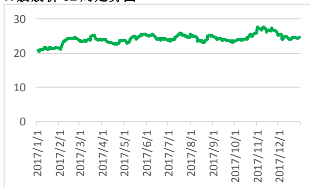
H 股股价 52 周走势图